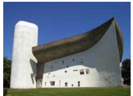
ロンシャンの教会

主催: ひと・環境計画 エコスの会 TEL 03-3368-6764 FaX. 03-3368-9272 E-mail: ecos@hitokankyo.com